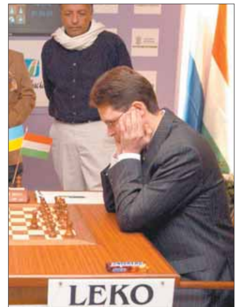
Lékó Péter a táblánál