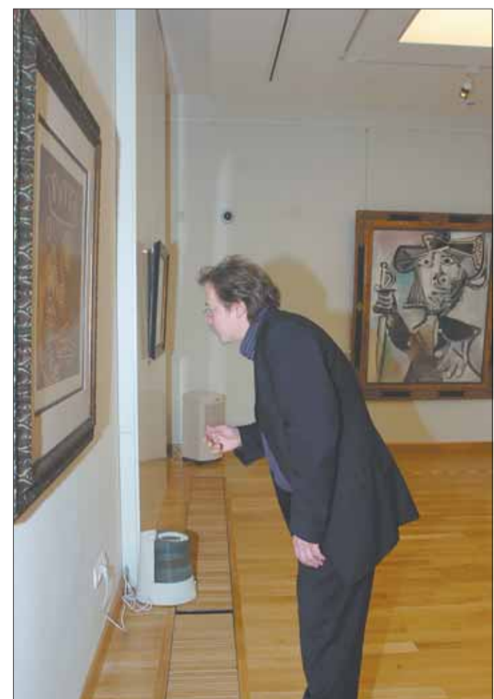
Elmélyült látogató Picasso előtt

A spanyol mester már nem érthette meg a Hommage á Picasso című kiállítás megnyitását, a berlini sajátos neorológ lett: negyven művész – így Miró, Rauschenberg, Vasarely, Warhol – tisztelegése a picassói életmű előtt. A kiállítás anyagát 150 millió forint-ra biztosították.