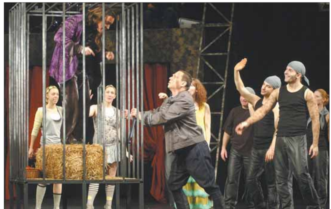
Jelenet A kisfiú és az oroszánokból