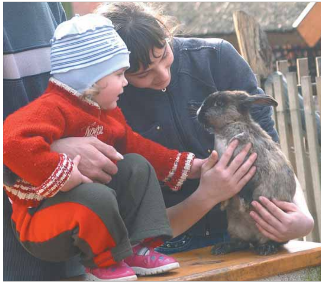
A vadaspark családi programnak is kiváló

Az állatkerteknek a világ minden táján négyes szerepük van: a természetvédelem, a kutatás, a szórakoztatás és az oktatás. Utóbbi miatt Szeged Város Önkormányzata és a vadaspark egy Magyarországon állatkerti szempontból teljesen új rendszert kíván bevezetni. Ennek lényege, hogy a városi fenntartásban lévő oktatási intézmények óvodásai, általános és középiskolásai évente egy alkalommal, rendkívüli kedvezményrel, szakmai belépőjegyet váltva – mely jelenleg 100 forint – látogathatják a Szegedi Vadasparkot. A gyerekek