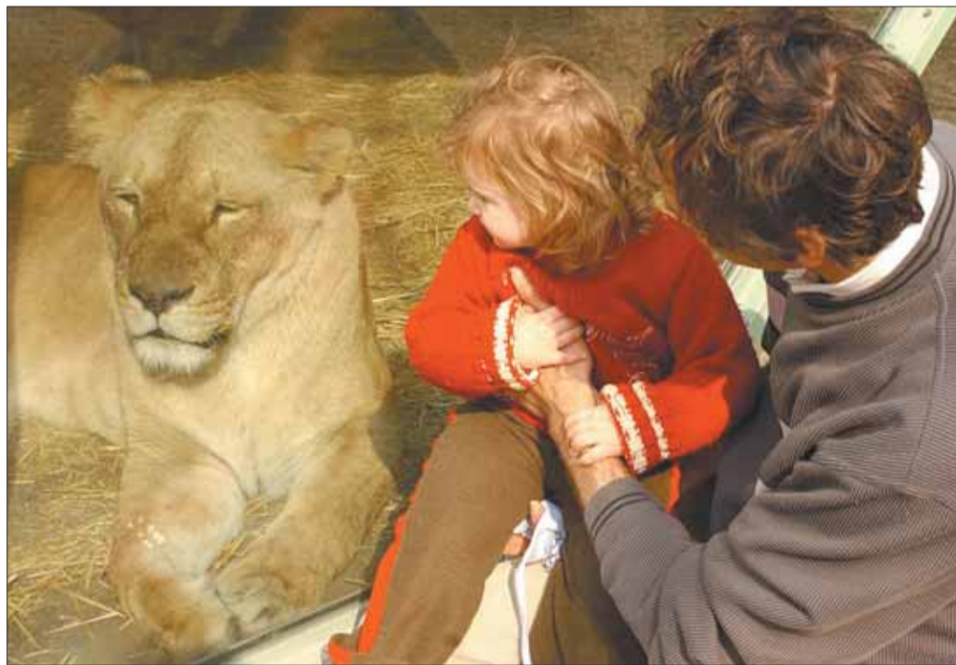
Az oroszlán és látogatói

A tavaly szeptemberi emlékeztető kutyatamadásból okulva – melynek következményeként elpusztultak a derby kenguruk és a mezopotámiai szarvasok – év végéig megerősítik a kerítést. Új takarmánytároló is épül, és a 2007-ben befolyt adók egy százalékából új tigriskifutót hoznak létre.