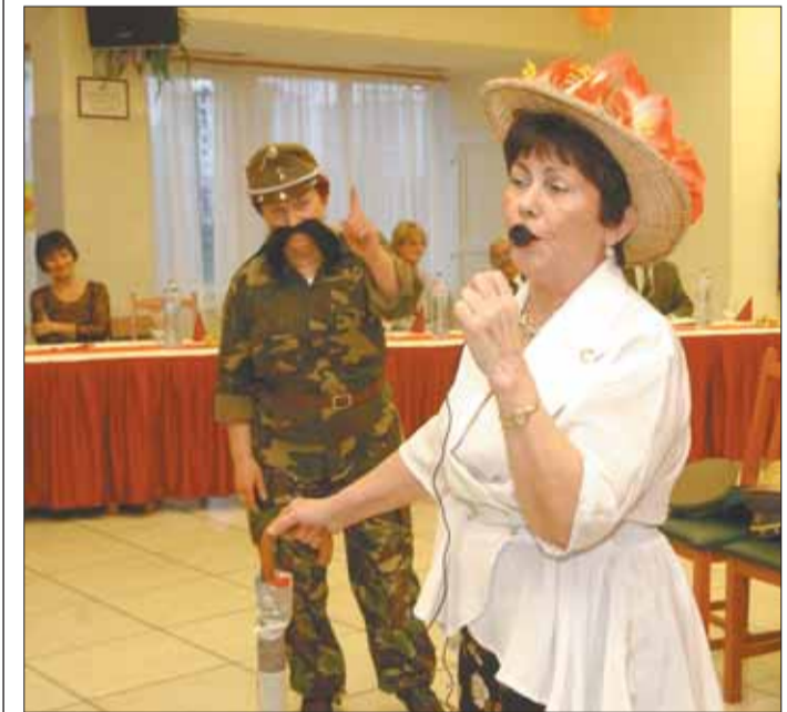
A kistérségi Ki mit tud? produkcióiból is láthattak összeállítást a vendégek

A bálon azonban nem kellett katonásan viselkedni, hiszen itt a szórakozás volt az egyetlen feladat. Önkormányzati cégek jóvoltából 5-10 ezer forint értékű tombolatárgyak is gazdára találtak. A szervező a végén megjegyezte: azért kezdik el a rendezvényt délután négy órakor, hogy aki nem akar taxira költeni, az az utolsó villamossal haza tudjon menni.