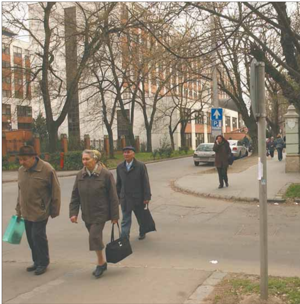
A Semmelweis és a Markovits utca sarkán is megáll majd a 8-as trolibusz

Új megállóhelyek létesülnek a Honvéd téren, az Aradi téren a Hősök kapuja mellett és a Semmelweis–Markovits utca sarkánál, míg visszafelé az SZTK előtti busz megállót érintik. A vonal elkészültével párhuzamosan néhány helyen megváltozik az utcák forgalmi iránya is. A Markovits utca burkolatát megerősítik és a jelenlegi egyirányúsítást „megfordítják”: a járatok a Boldogasszony sugáratul keresztezve haladnak majd tovább a Vitéz utcán, amely szintén egyirányú lesz, itt az út mindkét oldalán parkolóhelyeket alakítanak ki, ame-