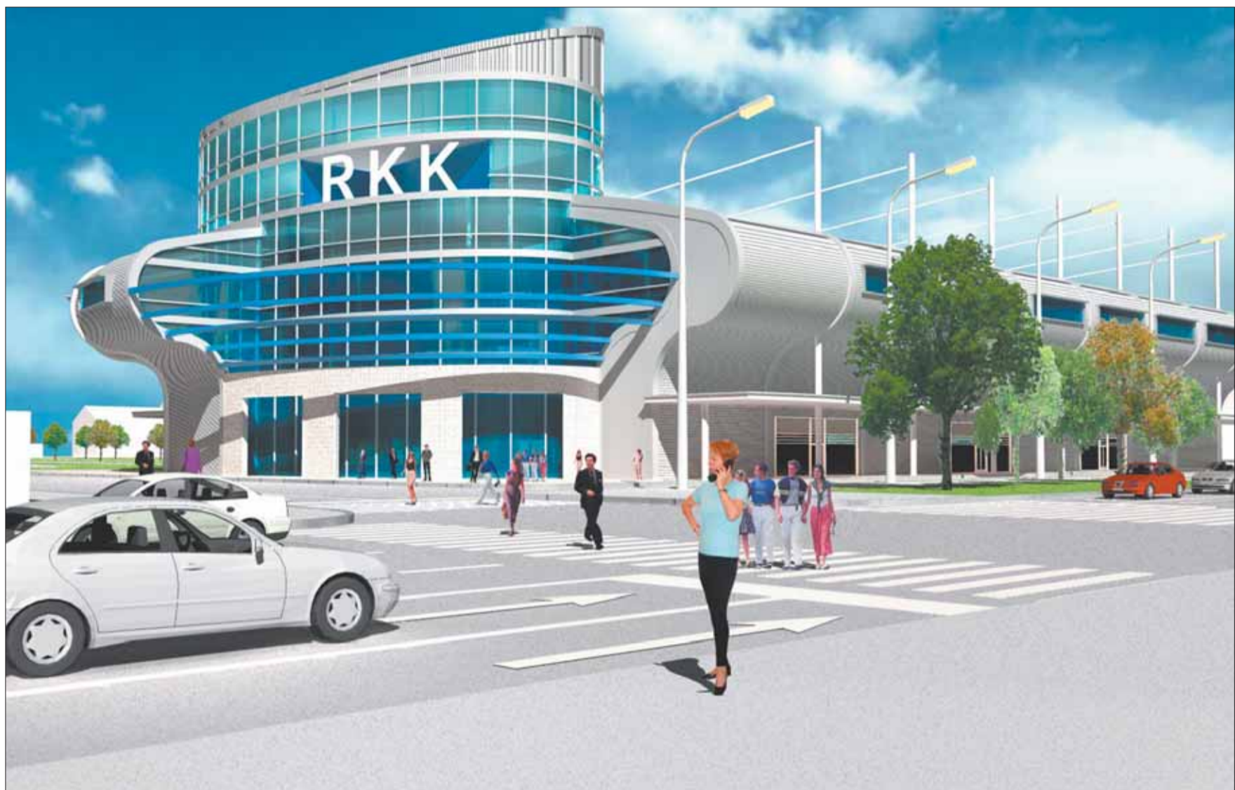
A Mars téri rendezvényközpont látványterve