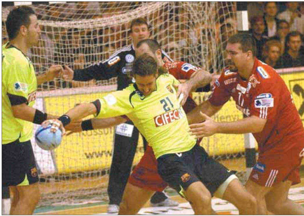
A többszörös BL-győztes Barcelona Szegeden nagy falatnak bizonyult, így hiába győzött március 15-én ellenfele otthonában immár tét nélküli mérkőzésen a Pick