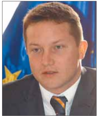
Ujhelyi István államtitkár: Az állam az elmúlt 6 évben 190 ezer panellakás felújítását támogatta

Szigorítják ugyan a támogatott panelfelújítások ellenőrzését, de nő az állami támogatás mértéke 2008-ban: az eddigi 400 ezerről félmillióra. Míg sok önkormányzat nem tudja vállalni a panelrekonstrukció támogatását, a szegedi továbbra is részt vesz benne, de már differenciál: a rászorultságot is mérlegeli, valamint odafigyel arra, hogy aki nem szegedi lakos, az ne részesüljön az önkormányzat pénzéből.