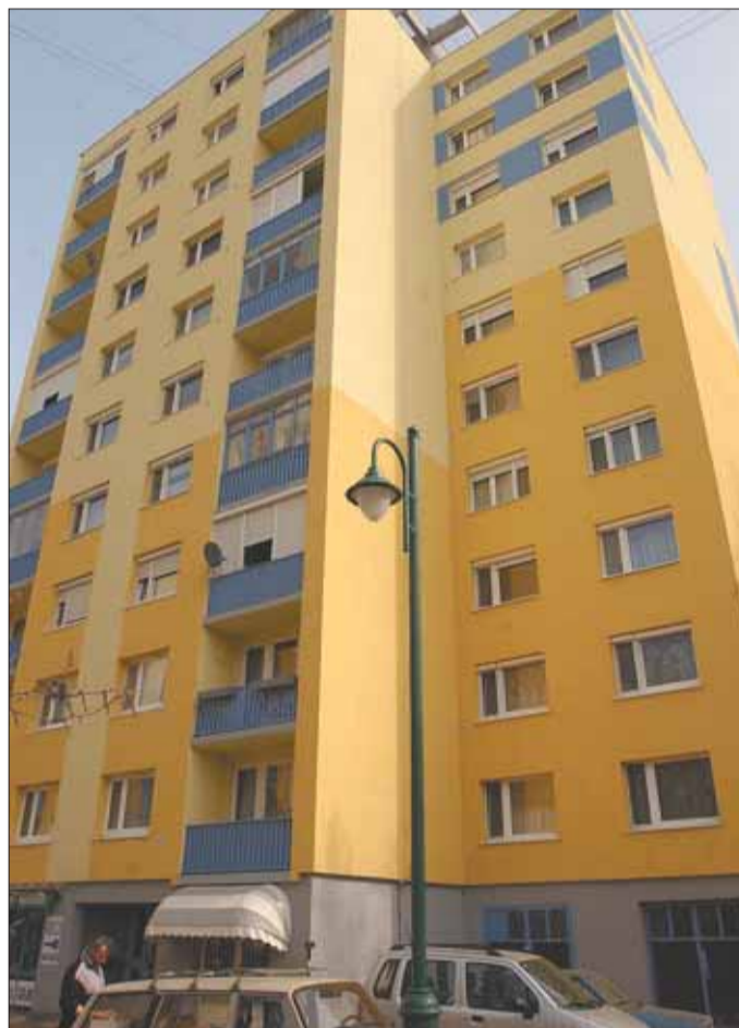
Felújított épület Tarjánban

2008-tól minden államilag támogatott felújításnál szigorúban ellenőrzik a kivitelezés és a felhasznált anyagok minőségét. A lakóközösségeknek ötéves adatszolgáltatási kötelezettségük lesz, hogy tudni lehessen, vajon megért-e a felújítás. A mostani szá-