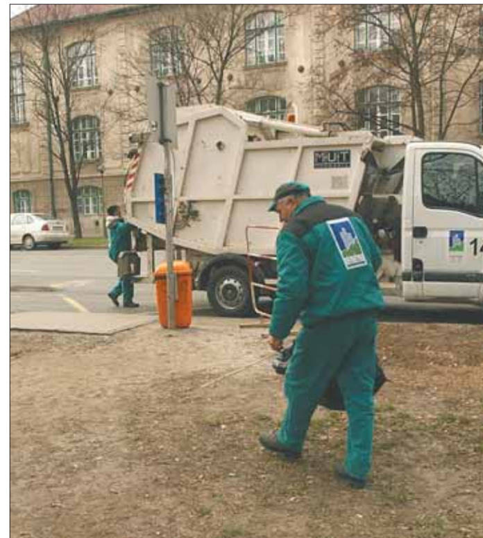
Szedik össze a téli szemetet

Március második felétől kezdik kicsomagolni téli ruhájukból a köztéri szobrokat, és pár héten belül a városi játszótérek is tisztán várják a legkisebbeket. Április első két hetében kerül sor a bábáskodók által erősen látogatott eseményre, a Belvárosi hidfürdetésre, s május elejére pedig tisztán áll működésre készen a napfény városának tucatnyi szökőkútja és csobogója.