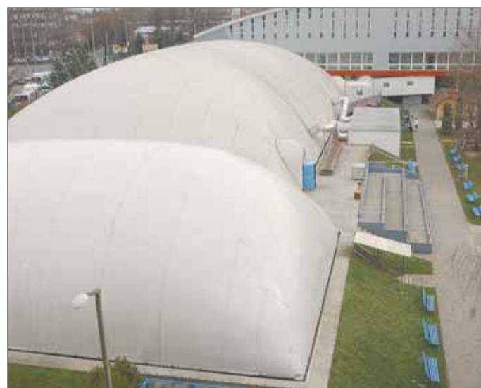
A jelenlegi sportuszoda a ponyvatetővel, az Etelka soron fedett épül

A tervek szerint 2010-re a SZEOL-pálya újraszületik, miközben vele párhuzamosan – az Etelka soron – befejeződik a fedett sportuszoda építése is. Az uszodához az induló tőke a pálya eladásából származik, de ez az összeg a hárommilliárdos beruházáshoz természetesen nem elegendő. Az önkormányzat tehát hitel vesz fel és kötvényeket bocsát ki, hogy megvalósítsa a fejlesztést. A kölcsön nagy részét majd az Aqualand önkormányzati üzletrésznél eladásából fizetik vissza. Az üzletrész értékét 1,4 milliárd forintba becsülik, értékesítésére